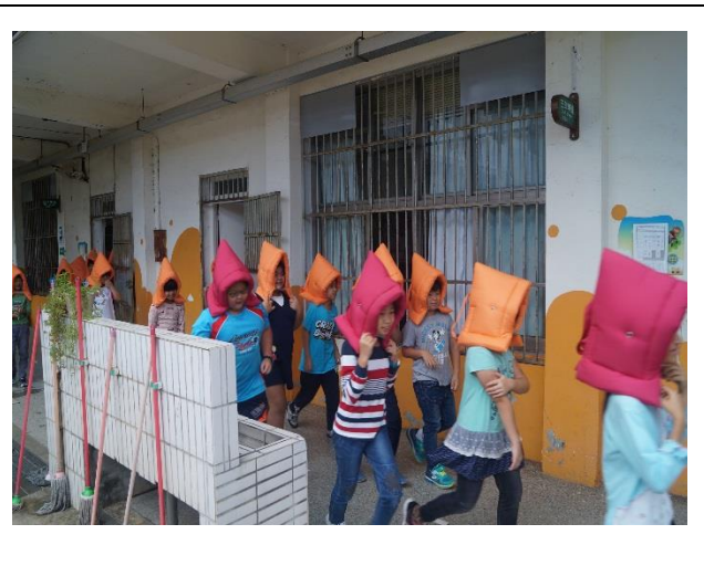
學生做到不語、不跑、不推前往集結區